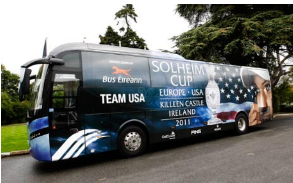
Ba iad Bus Éireann an chuideachta iompair oifigiúil d'fhoirme Mheiriceá agus na hEorpa don Solheim Cup.

Bhí an Solheim Cup ar siúl i gCaisleán an Chillín, Contae na Mí agus ba iad Bus Éireann an chuideachta iompair oifigiúil d'fhoirme Mheiriceá agus na hEorpa agus iompróir oifigiúil na ndaoine móra le rá, na réiteoirí agus na meán.