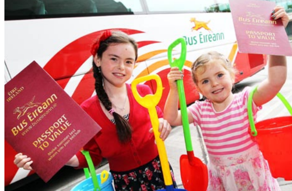
Passport to Summer.