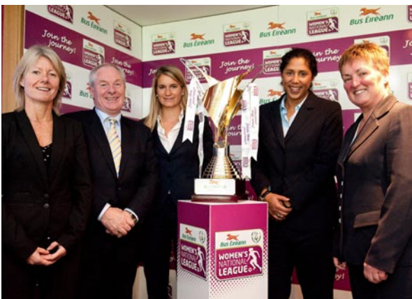
Michael Ring, T.D., an tAire Stáit Turasóireachta agus Spóirt ag seoladh Shraith Náisiúnta na mBan le Bus Éireann i nDeireadh Fómhair 2011.

Rinne Bus Éireann urraíocht ar chomórtais náisiúnta iomána agus peile Fhéile Peile na nÓg agus Fhéile na nGael faoi 14 de chuig CLG. Ghlac os cionn 8,000 imreoir óg as gach cearn d'Éirinn agus thar lear páirt san imeacht.