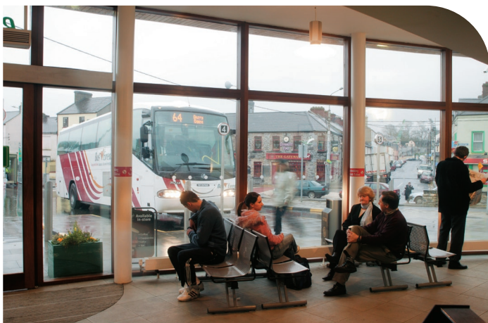
An Taobh Istigh de Stáisiún Bus Shligigh atá nua-athchóirithe.

Léirítear an infheistiú sa líon leanúnach ard custaiméirí i 2004, agus ráta sástachta an-ard custaiméirí, le custaiméirí Bhus Éireann ag tuairisciú ráta sástachtacht 91% tar éis iniúchadh neamhspleách ar na tiomantais a thug Bus Éireann ina Chairt Paisinéirí.