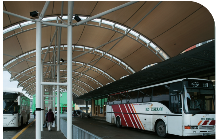
Cumhdach Nua ag Stáisiún Bus Chathair Chorcaí

I 2004, lean Bus Éireann de bheith ag tógáil, ag nuachan agus ag feabhsú a ghréasáin lánpháirtithe seirbhísí a chuirtear ar fáil do chustaiméirí agus tá sin déanta ag rátaí ísle fóirdheontais agus ar leibhéil ísle táillí de réir chaighdeáin na hEorpa.