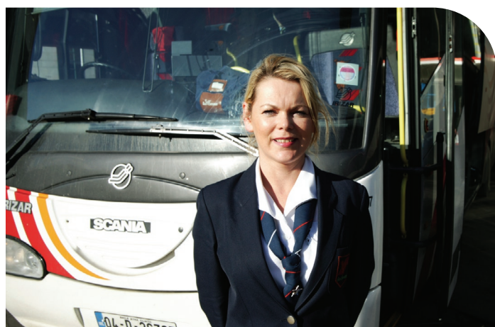
Bus Éireann ag 'Infheistiú i nDaoine'

Is iad cuspóirí formiolána na cuideachta i bhforbairt bhainistíochta ná, a chinntiú a mhéad is féidir é, go mbíonn ar chumas na bainistíochta déileáil le dúshlán i dtimpeallacht athraitheach agus an próiseas do phleanáil comharbacht a fheabhsú.