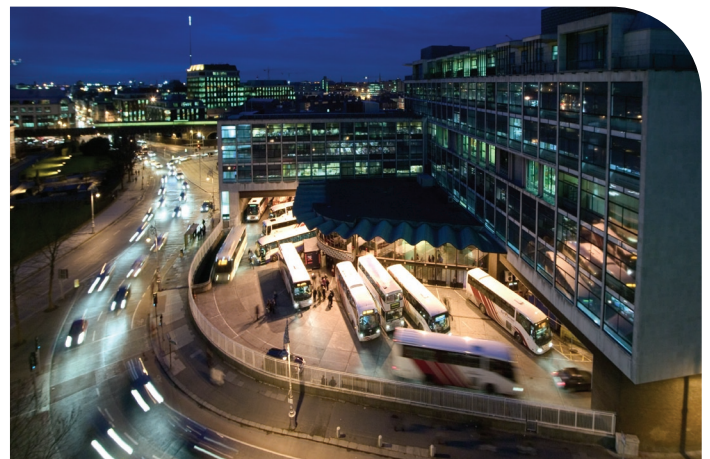
Radharc ón spéir ar Bhusáras, Baile Átha Cliath