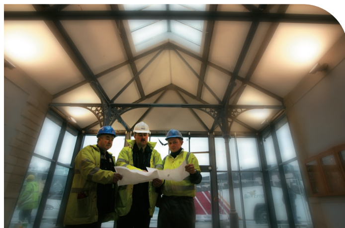
Obair athchóirithe ar cheann dár stáisiúin bus.

Rinneadh obair athchóirithe ar roinnt stáisiúin bus chun rochtain a fheabhsú do chustaiméirí a bhfuil lagú gluaiseachta ag gabháil dóibh le maoiniú ón bPlean Forbartha Náisiúnta. Is iad na stáisiúin a bhain buntáiste as na tionscadail feabhsúcháin inrochtaine ná Baile Átha Cliath (Busáras), Béal an Átha, Leitir Ceanainn agus Corcaigh.