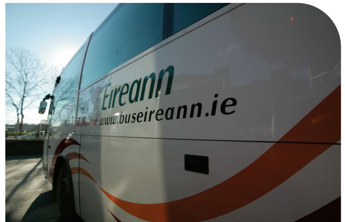
Libhré Feithicle nua

Tugadh isteach 101 seirbhís nua iompair scoile i rith 2004, sa réimse iompair do leanaí le riachtanais speisialta den chuid