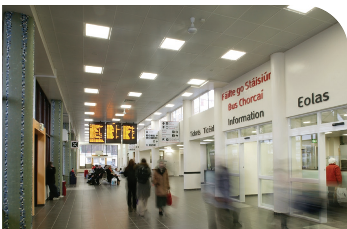
An Taobh Istigh de Stáisiún Bus Chathair Chorcaí, Plás Parnell atá nuachóirithe.

Ó 2000 i leith, tá an líon custaiméirí ar bhealaí achar fada agus comaitéara méadaithe 25%. Ar sheirbhísí cathrach Bhus Éireann, mar thoradh ar mhinicíochtaí níos airde a bheith á dtairiscint agus uasghradú leanúnach na flít, tá méadú de 10% tagtha ar an líon custaiméirí a iompraíodh le cúig bliana anuas.