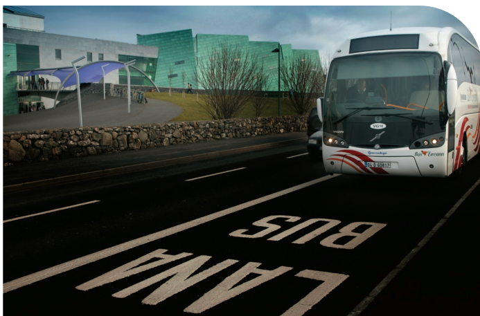
Seirbhís Aistear Fada le I.T. na Gaillimhe-Maigh Eo sa chúla.

Cuireadh seirbhísí comaitéara breise ar fáil in ionaid ar nós an Muileann gCearr, Baile Átha Cliath, Baile Mhistéala, Port Láirge, Trá Mhór, Sligeach, Béal an Átha, Cill Airne, Neidín agus Corcaigh.