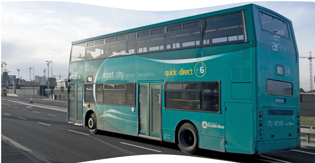
Thaisteal thar 1 milliún paisinéir ar Airlíon Express Bhus Átha Cliath i 2007.