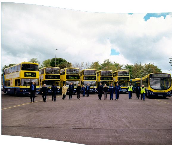
Tá rath leanúnach Bus Átha Cliath bunaithe ar chomhiarracht na foirne go léir.

B'ionann an t-ioncam iomlán de na Turais do 2007 agus €6.5 milliún i gcomparáid le €6.0 milliún i 2006, méadú 8%. Baineadh an fás seo amach le cúnaimh ó lár-chóras nua-fhorbartha na n-áirithintí le haghaidh turais lae agus suíomh gréasáin fámaireachta nua www.dublinsightseeing.ie a chuaigh beo i Meitheamh 2007 agus atá an-rathúil.