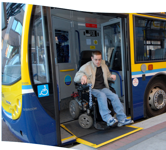
Bhí urlár íseal atá inrochtana do chathaoir rotha ag 70% de chabhlach Bhus Átha Cliath i 2007.