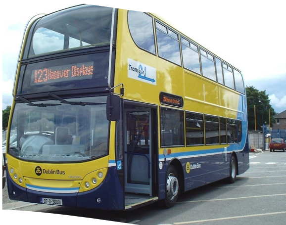
Bus de dhéanamh EV a cuireadh le cabhlach Bhus Átha Cliath i 2007.

Léirigh tuarascáil a rinne comhairleoirí BDO Simpson Xavier i 2006 gurb ionann brú tráchta agus costas €60 milliún in