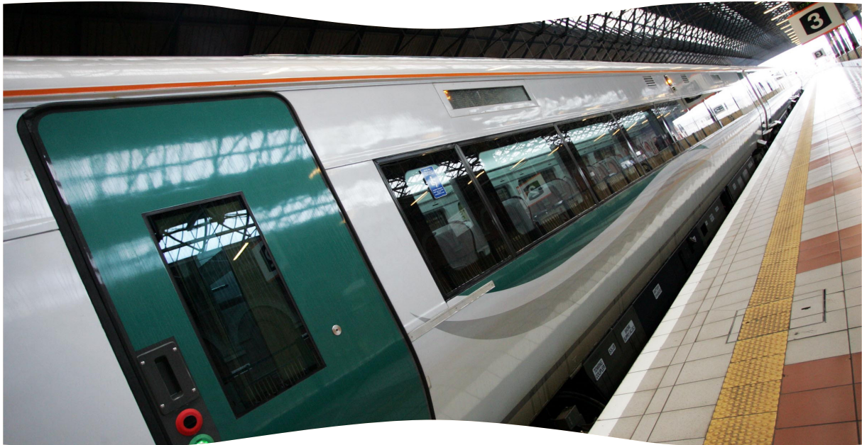
Ráilcharr Idirchathrach nua Iarnród Éireann, a tháinig isteach i seirbhís ar líne Sligeach/Baile Átha Cliath i mí na Nollag 2007.

Lean an clár infheistíochta is mó riamh i líonra agus seirbhísí Iarnród Éireann ar aghaidh ag íoc díbhinní i 2007, le curriarracht eile leagtha don líon is airde riamh de thurais phaisinéirí a taifeadh, 45.5 milliún turas. I measc gnéithe eile bhí: